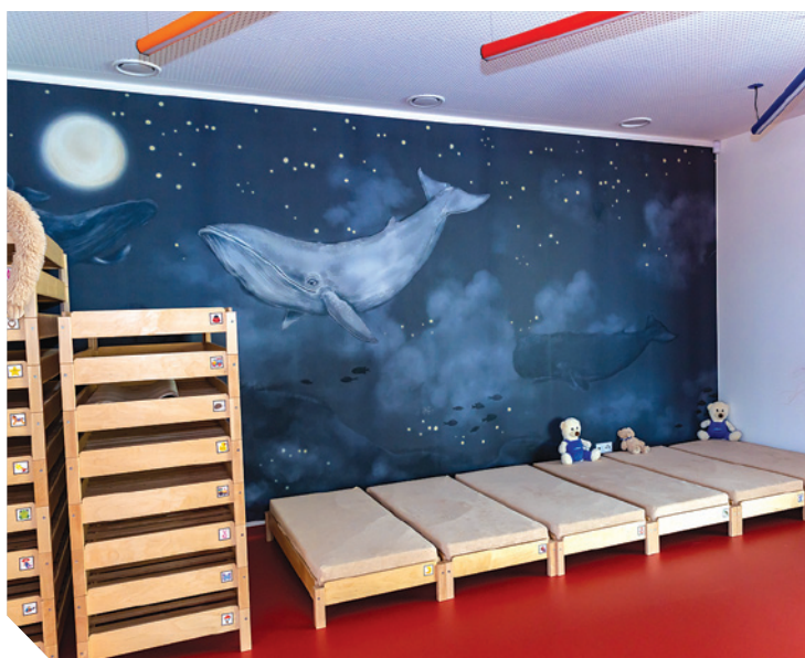
Dětská skupina Pastelka