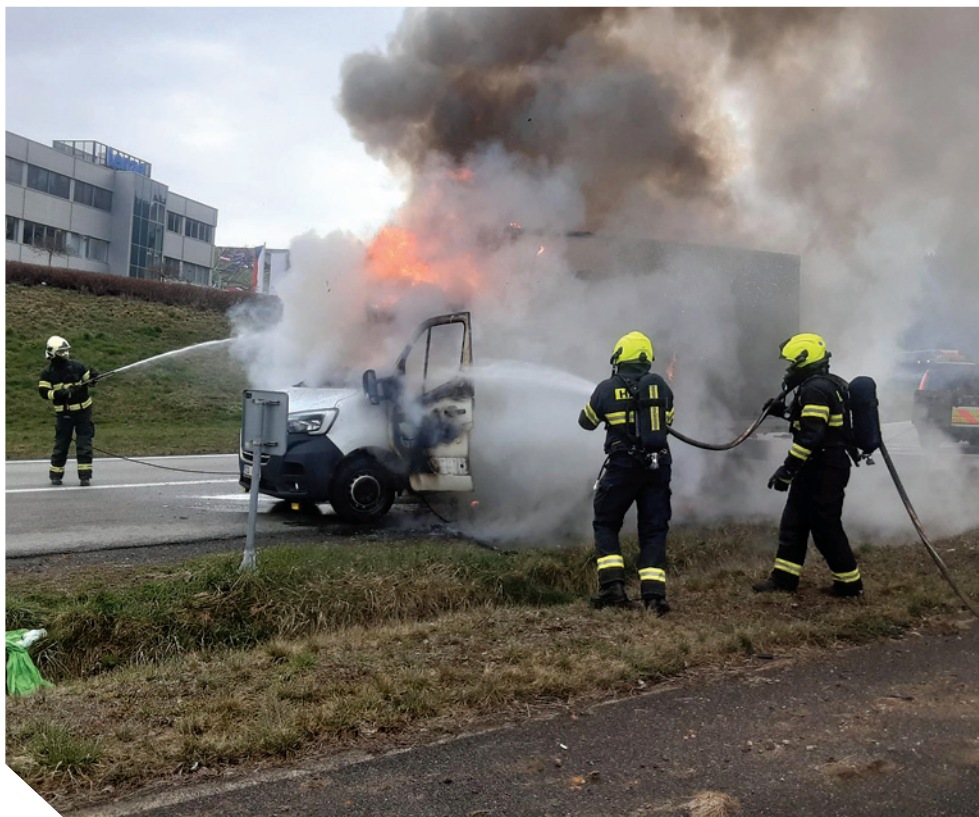
zásah HZS u požáru dodávky