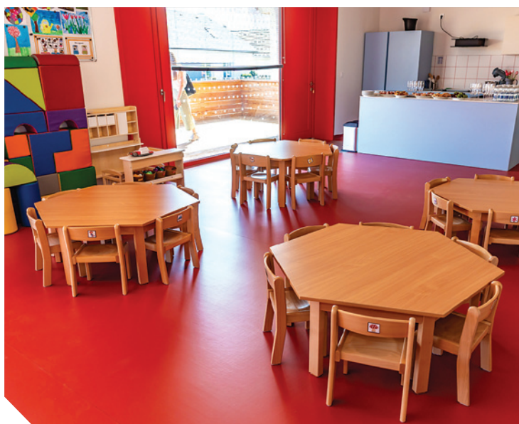
Dětská skupina Pastelka