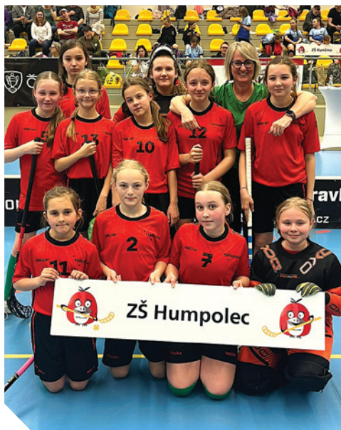
florbalistky 1. stupně ZŠ Hálkova