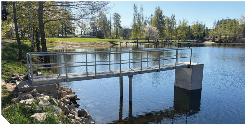
nové stavidlo na Plačkovském rybníku