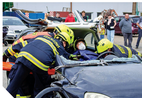
ukázka vyprošťování osob

Během několika minut hasiči krok za krokem předvedli celý postup zásahu — od zajištění a stabilizace vozidla přes odstranění dveří pomocí hydraulického rozpínáku až po vyřezání skel a odstřižení sloupků