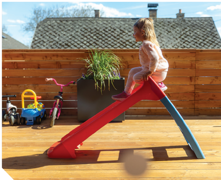
Dětská skupina Pastelka