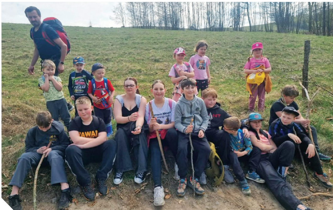
jarní tábor mladých hasičů