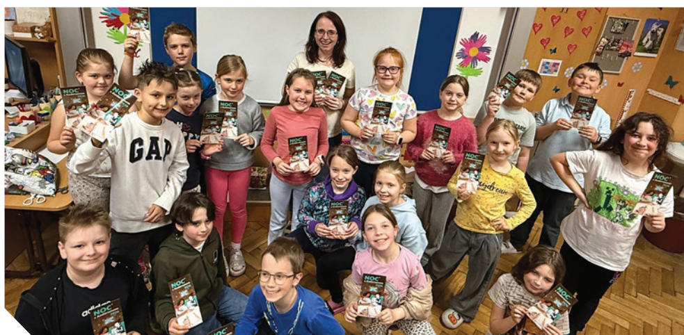
Noc s Andersenem na ZŠ Hradská

V průběhu internetové, tedy náborové fáze soutěže jsou v nepravidelných intervalech zveřejňovány dva typy her – elektronická kola a bonusovky. Bodové konto sčítá body maximálně 16 nejúspěšnějších jednotlivců z dané třídy. Po sestavení pořadí