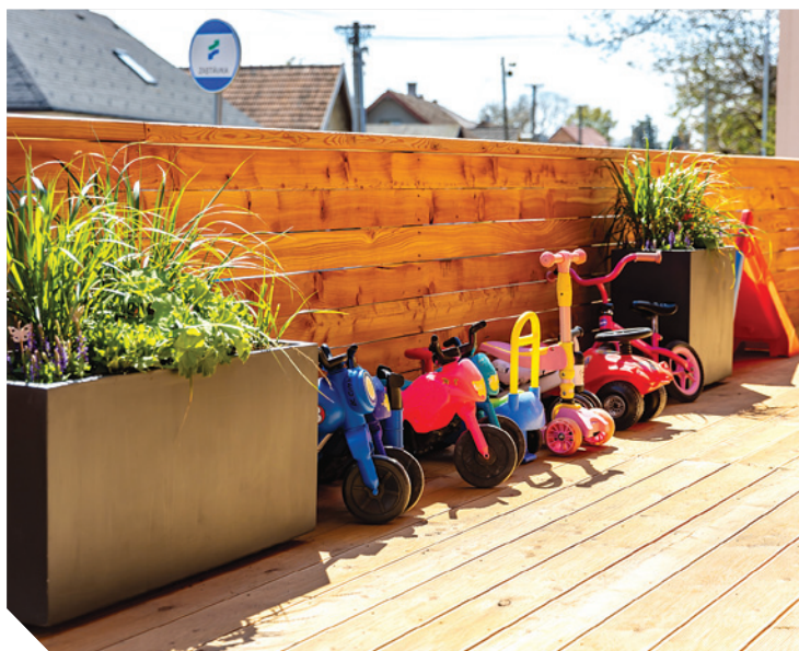
Dětská skupina Pastelka