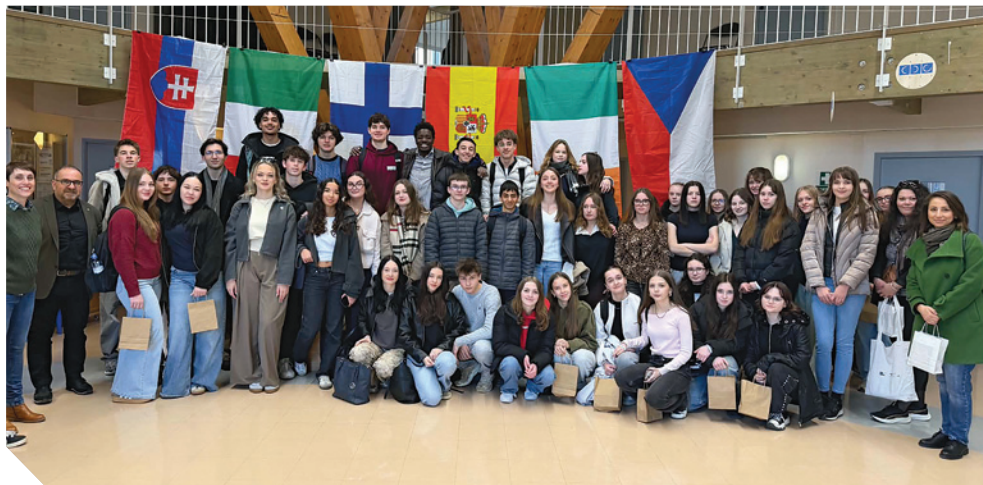
Účastníci výměnného pobytu