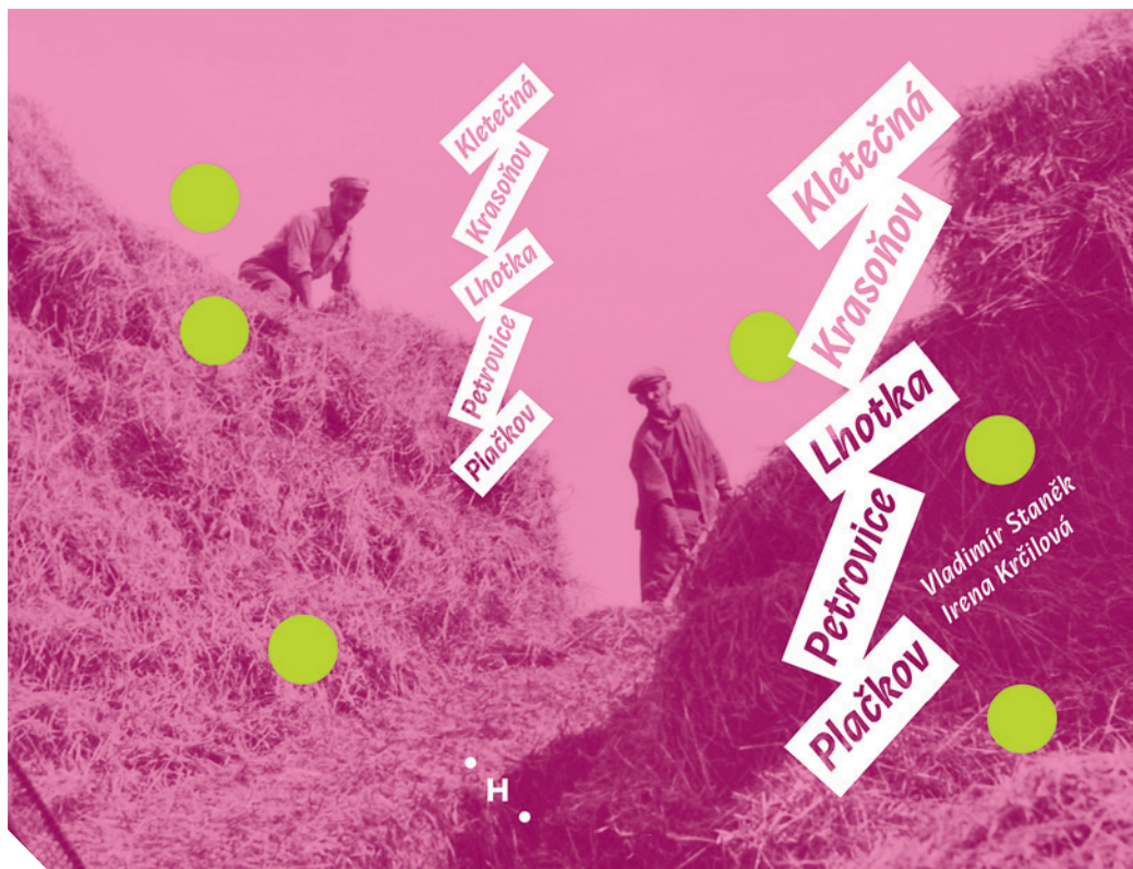
přebal knihy Kletečná, Krasoňov, Lhotka, Petrovice, Plačkov