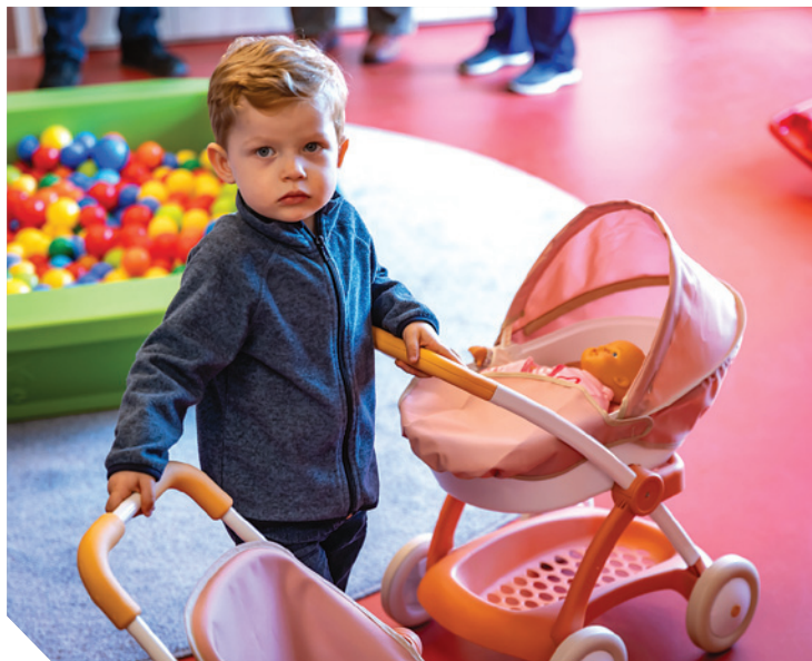
Dětská skupina Pastelka