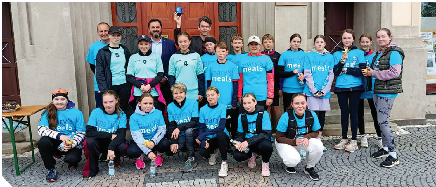
město Humpolec: podpořilo žáky a učitele ZŠ Humpolec, Hálkova ve štafetě Move for Hope