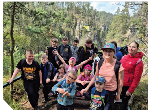
jarní tábor mladých hasičů

Jaký by to byl konec měsíce dubna bez pálení ohně a lampionového průvodu? Ve dvacet hodin vyšel z areálu Rafanda a po příchodu