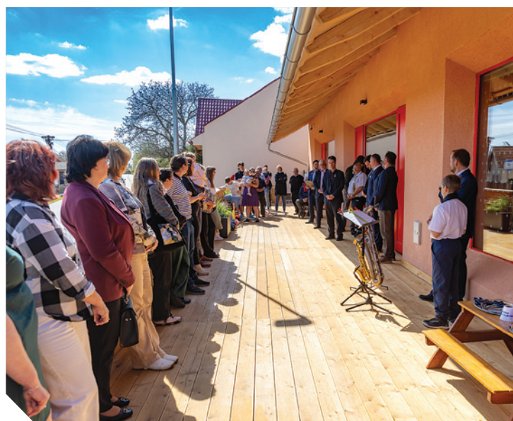
slavnostní otevření Dětské skupiny Pastelka