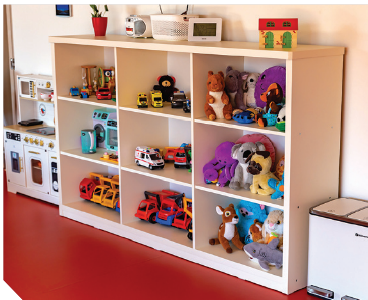
Dětská skupina Pastelka