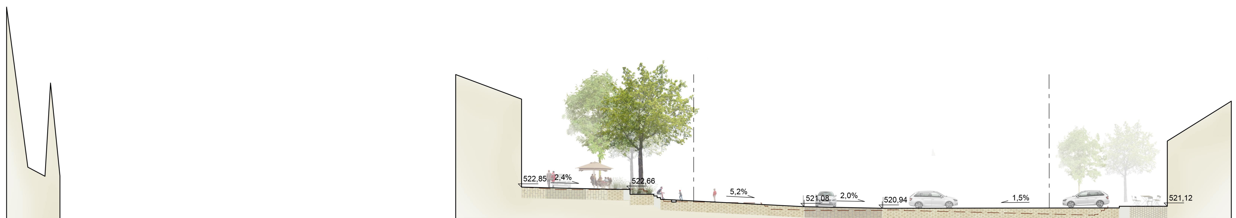
Řez C-C Dolní náměstí 1:200