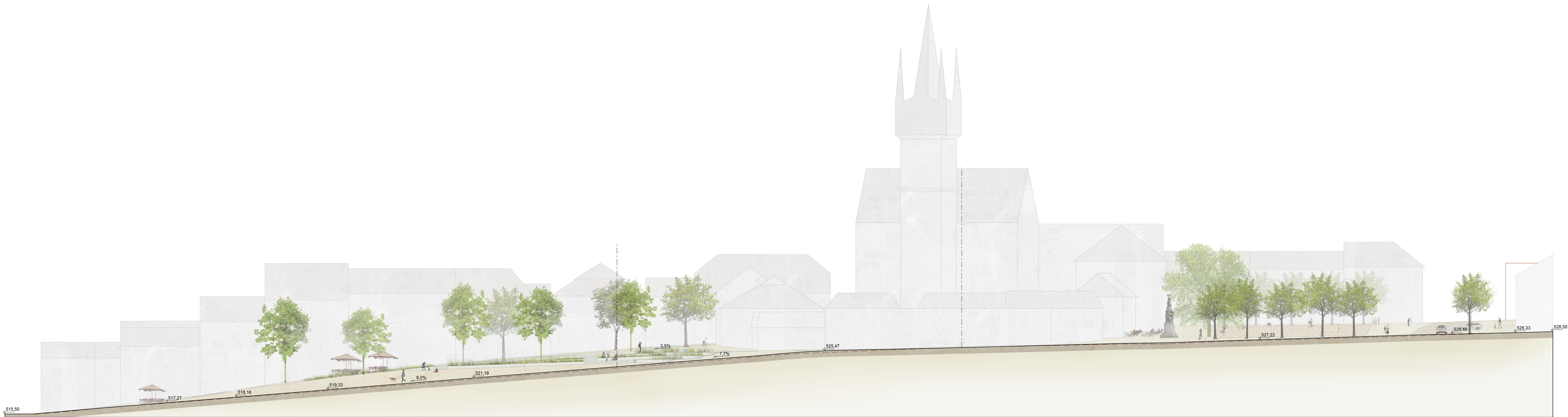
Řez A-A Horní a Dolní náměstí 1:200