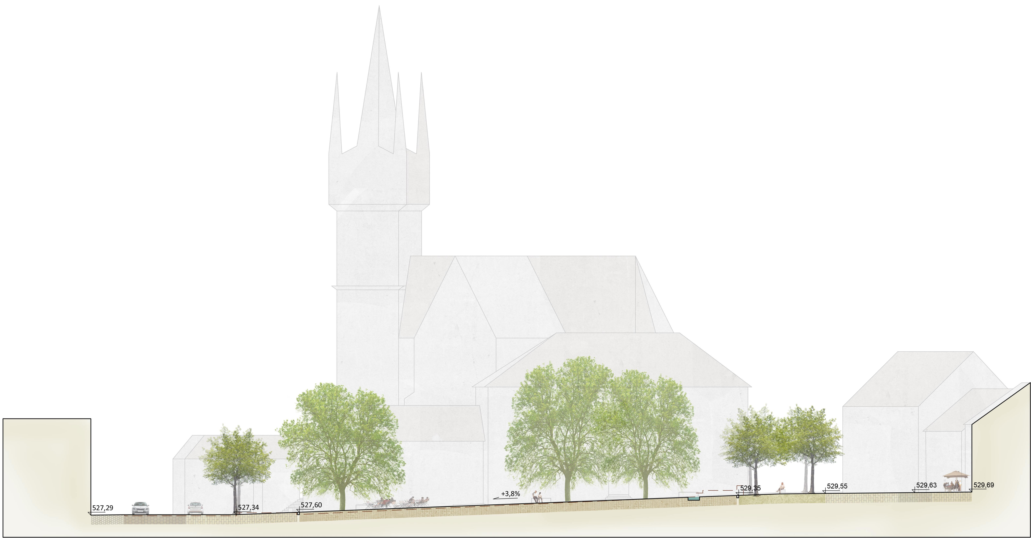
Řez D-D Horní náměstí 1:200