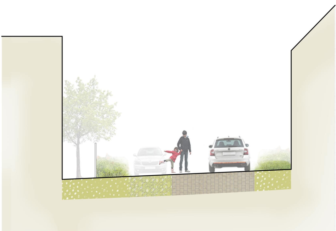
Charakteristický řez - Zichpíl 1:100