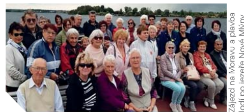
Zájezd na Moravu a plavba lodí po jezerech Nové Mlýny

Značné oblíbení si získala přátelská posezení, jako jsou akce k MDŽ a svatomartinské akce. Zde nám ochotně vyšla vstříc jídelna „Rodinka“, kde nám uvolnili prostory jídelny, kuchařky nám připravily super chutný, upravený oběd se zákusky (svatomartinskou kachnu na rozmarýnu s červeným zelím a knedlíkem), kde účastníci setkání říkali: „Jsme tady jak na svatbě.“ Byla i hodnotná a bohatá tombola, volně přístupné zákusky, každý se sám obsloužil, mohl si udělat vídeňskou kávu se šlehačkou, za pivo a nealkoholické pivo nikdo peníze nevybíral, vedle byla krabička s penězi, každý se sám obsloužil, zaplatil a nikdy nechyběla ani koruna. Hudbu nám